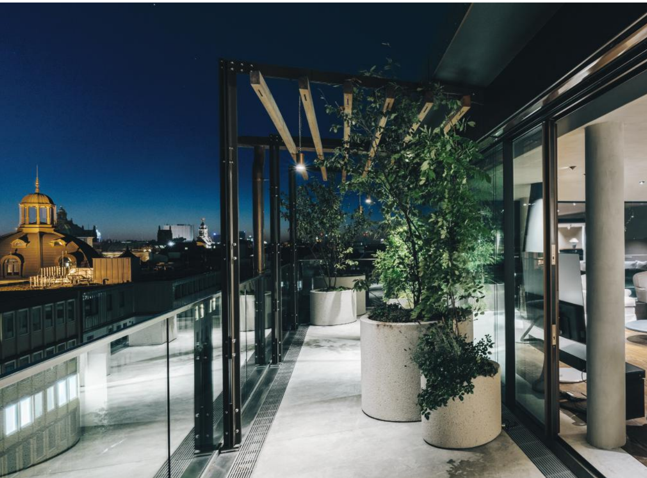
TERRASSE UND BETONFRIES, HOTEL BAYERISCHER HOF MÜNCHEN

Nach über 20 Jahren Erfahrung in der Baubranche wagen wir es, eine Aussage zur Nachhaltigkeit in Verbindung mit dem Werkstoff Beton zu treffen. Nutzen für mehrere Generationen anbieten zu können und im Unternehmen möglichst wenig Abfall zu produzieren ist uns ein Anliegen. Zudem freut es uns, dass Betonzulieferer, die nach ökologischen Maximen arbeiten, unsere Partner sind.