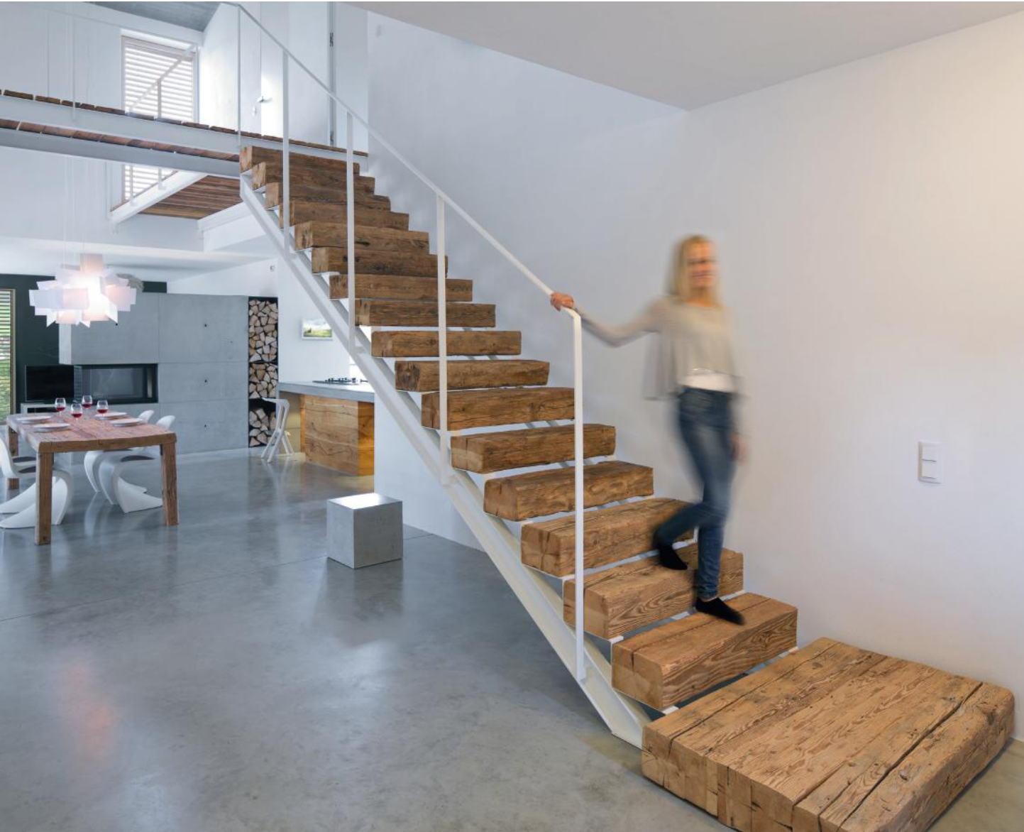
WB_10, PRIVATHAUS, BETONCUBUS 40X40