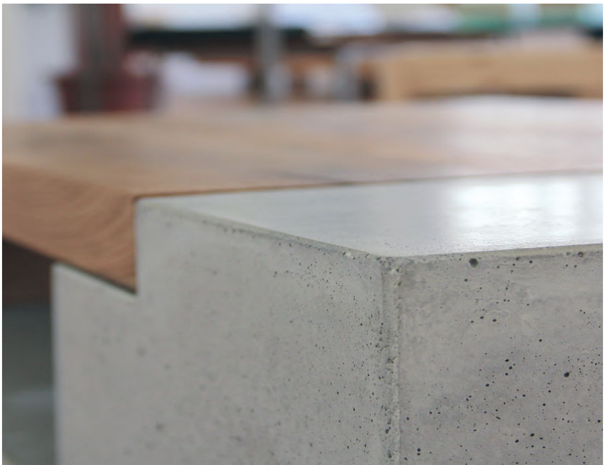
SCHALUNGSBAU NACH MASS, DETAIL TISCH BERNSTEIN

Spezielle Lasuren, Wachs und Öl lassen eine pflegeleichte Oberfläche entstehen. Das Finish gibt es in matter und glänzender Ausführung. Die natürliche Erscheinung des Betons steht im Vordergrund. Auch im Winter halten es die Werkstücke im Freien aus - getestet und für gut befunden und daher praktisch, funktionell und schön in Einem.