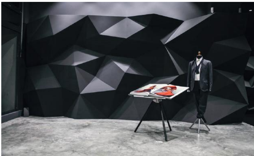
WB_1, SHOP STRICTLY HERRMANN, WIEN

WB_1 gibt es auch abgefärbt in Anthrazit, er eignet sich für Umbauten und in Shops, Lokalen oder wenn es besonders schnell gehen muss.