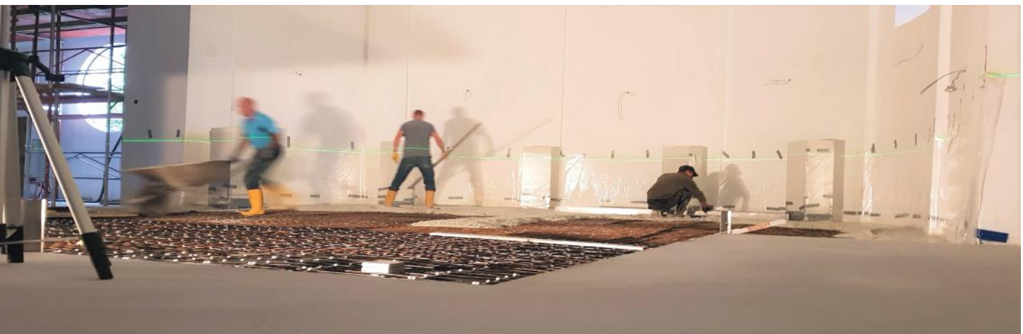
HERSTELLUNG EINES BETONBODENS IN WEISS, PFARRKICHE AMPFLWANG