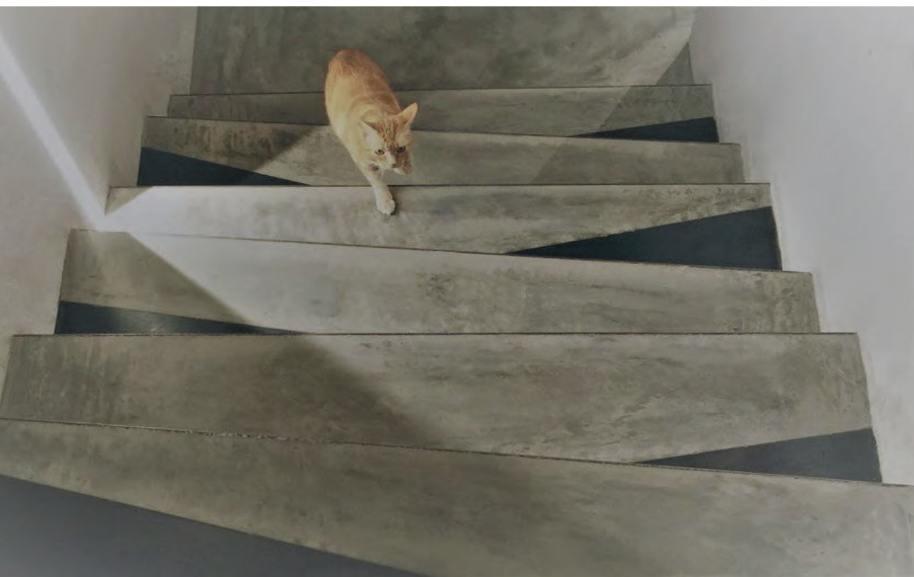
TREPPE MIT SCHWARZSTAHLDETAILS, PRIVATHAUS

Es ist möglich, dass wir Betonfertigtreppe finishen, oder Ihre Treppe vor Ort nach Ihren Wünschen gestalten. Bei einer Kundin wurde eine Treppe mit außergewöhnlichen Trittstufen aus Beton und Schwarzstahl hergestellt.