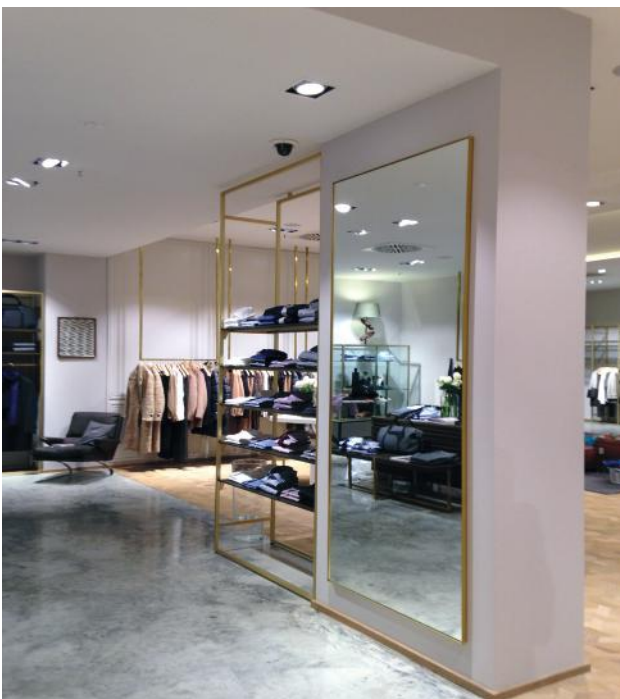
WB_1, RENÉ LEZARD SHOP, MÜNCHEN

Auch wenn Räume stark frequentiert sind, ist WB_1 geeignet. Beim Shop des Modeherstellers René Lezard wurde Beton mit Holz kombiniert. Die Schienen für Abschlüsse können von uns auch bei der dünnen Betonbodenvariante gesetzt werden.