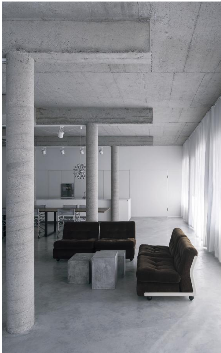
WB_10, UMBAU LOFT PRIVAT