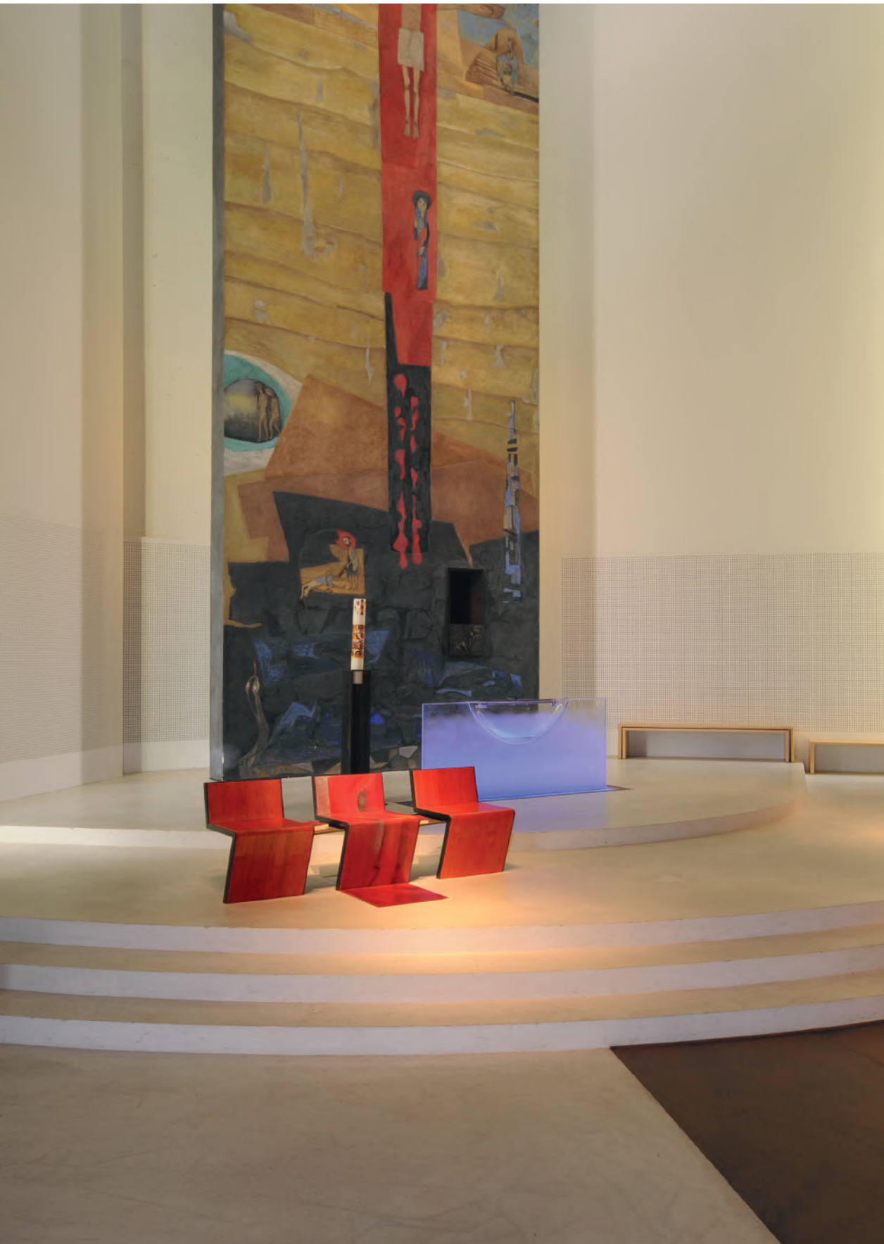
WB_10, WEISSBETON, FROESCHBERGKIRCHE LINZ