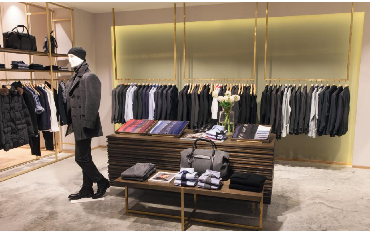
WB_1, RENÉ LEZARD SHOP, MÜNCHEN