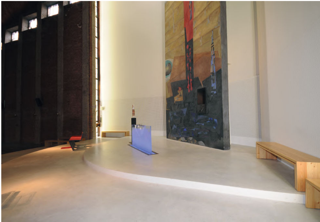
WB_10, WEISSBETON, ABSCHALUNG RUND IM ALTARRAUM, FROSCHBERGKIRCHE LINZ

Weißbeton ist ein durch Pigmentzugabe gefärbter Beton, den wir selbst mischen. Ein gut gehütetes Firmengeheimnis und unsere Königsdisziplin. Der erste Boden wurde im französischen Centre Pompidou hergestellt. Seither wurden im privaten Wohnbau und im Sakralbau Böden gegossen. Weißbeton gibt es in der Variante WB_10, mit 9-10 cm Stärke.