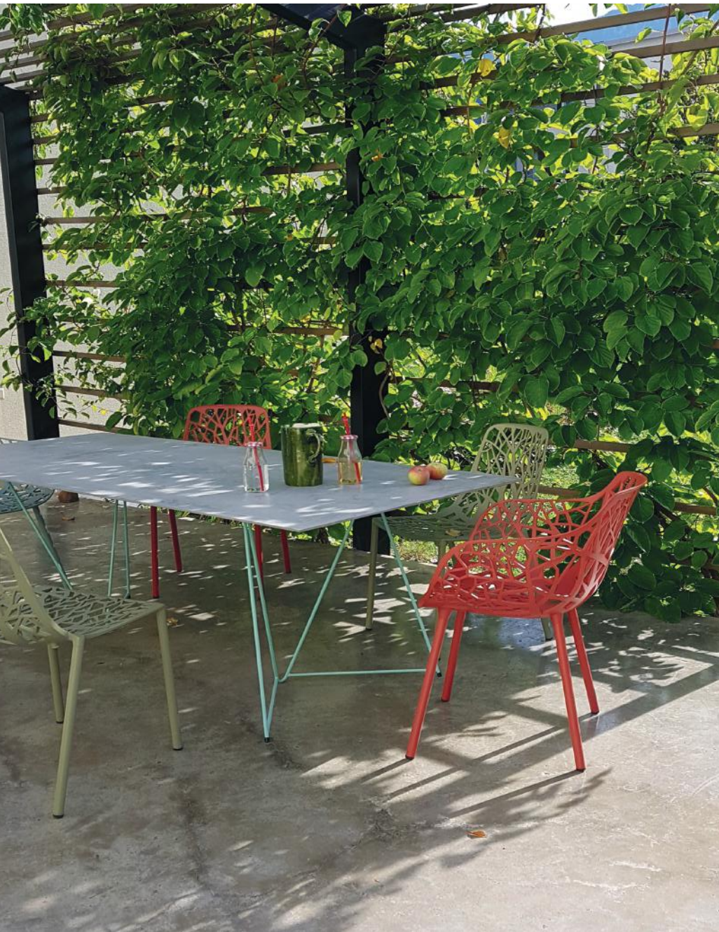
WOHNBETON TERRASSE, PRIVATHAUS

Auch im Außenbereich bietet sich Beton an. Durch die Witterung erhält Beton im Freiraum mit den Jahren - ähnlich wie Steinelemente - eine Patina. Der Boden erhält dadurch eine rauhere, „rouge“ Optik.