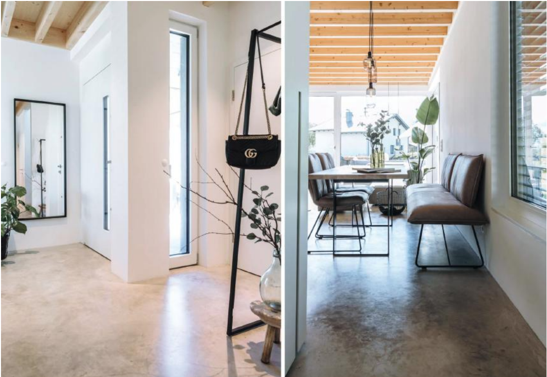
WB_10, PRIVATHAUS, RAUMKONZEPT KRUMHUBERDESIGN