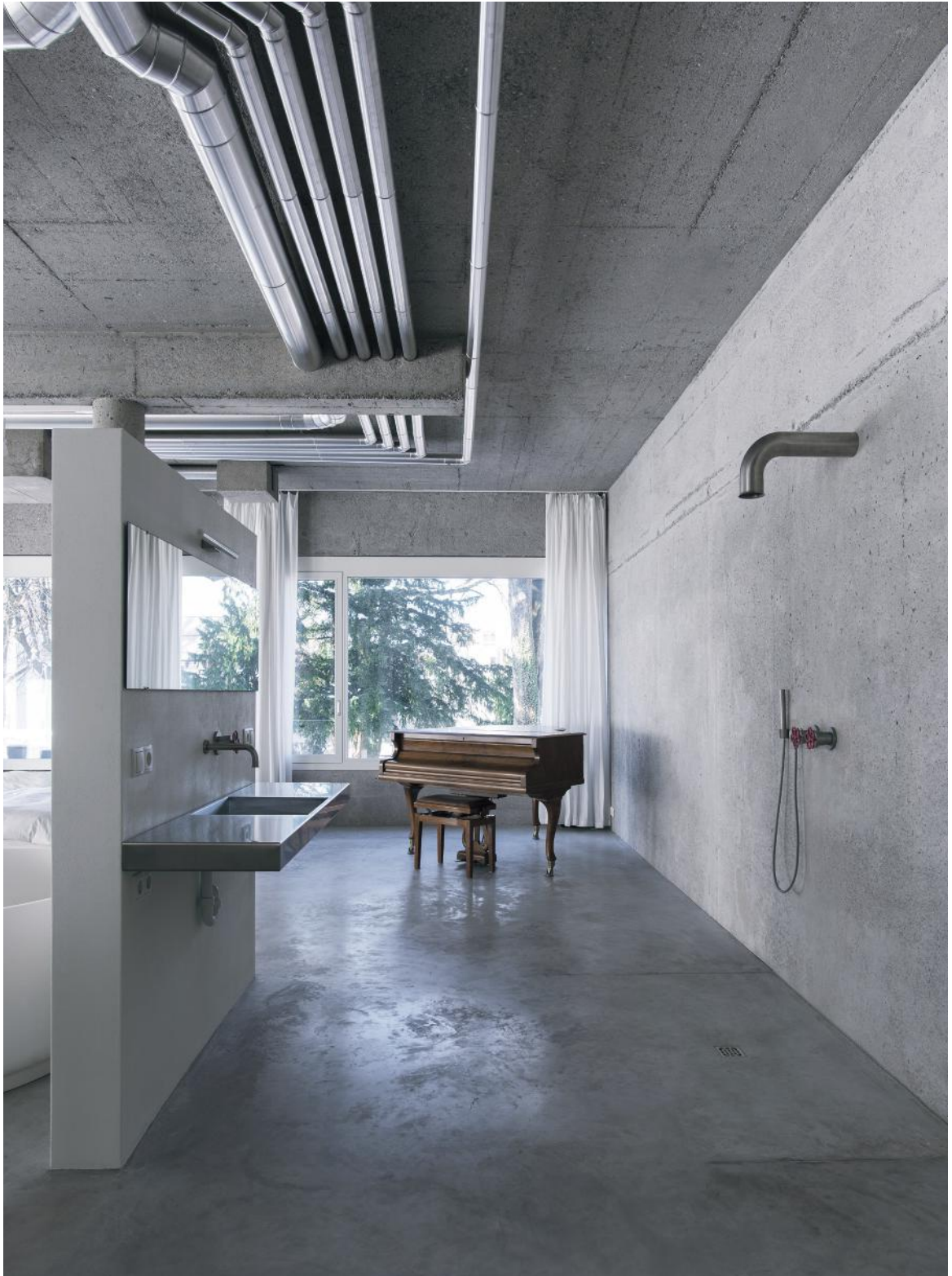
WB_10, UMBAU LOFT PRIVAT

Bei einem Umbau wurde vom Inhaber eines zuvor als Café genutzten Lofts auf minimalistischen Stil gesetzt. Ein Freilegen der bestehenden Betondecken und die Böden von Wohnbeton führen zu diesem spannenden Konzept - „Reduktion auf Wesentliches“.