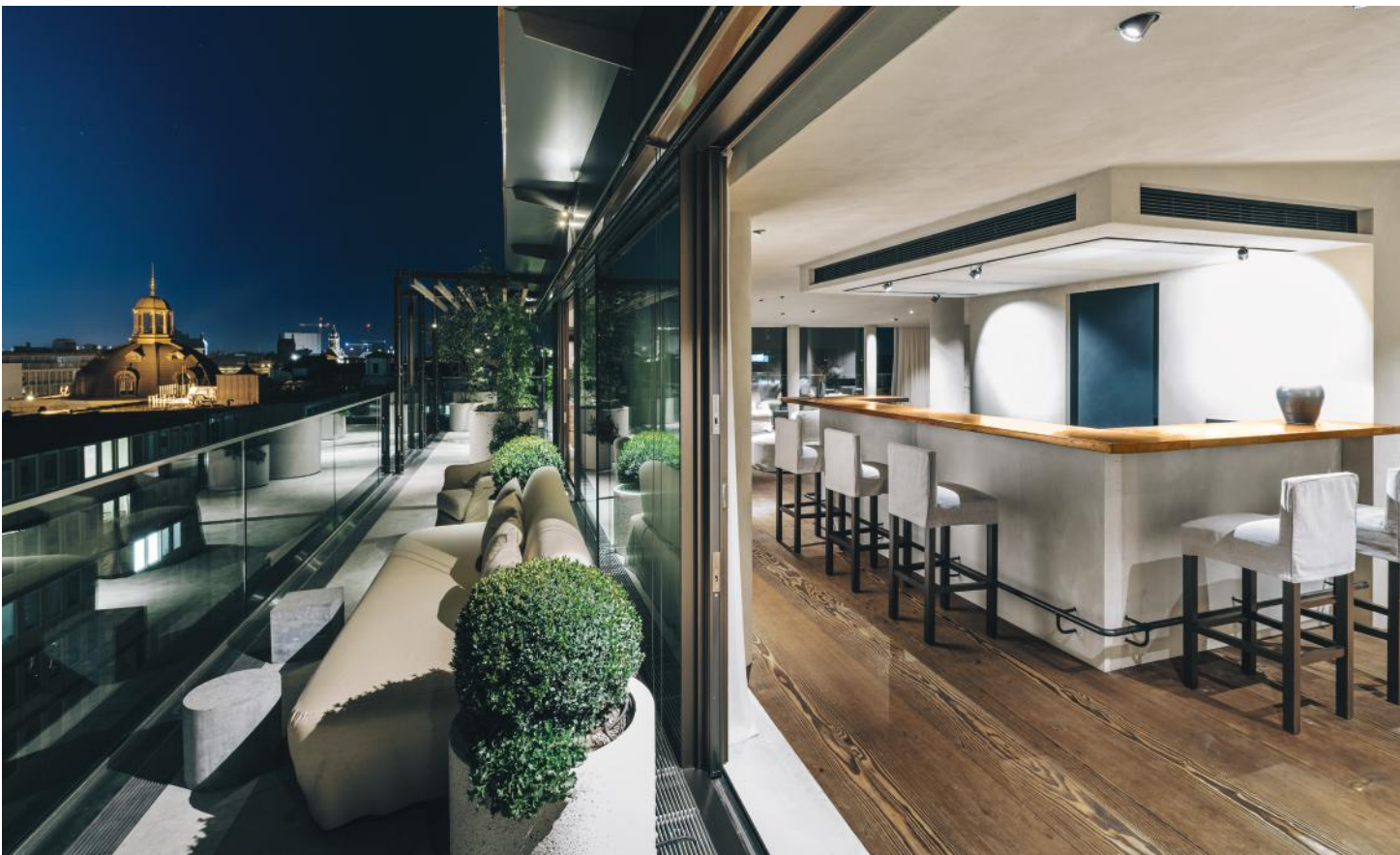
PANELE FÜR THEKE UND BETONFRIES, HOTEL BAYERISCHER HOF MÜNCHEN

Eine effiziente Heizung ist möglich, da unsere Böden in Kombination mit Fußbodenheizsystemen die Wärme über einen längeren Zeitraum speichern und langsam an den Raum abgeben. Im Sommer kann man den Wasserdurchlauf im Boden auf einfache Weise als natürliches Klimasystem nutzen.