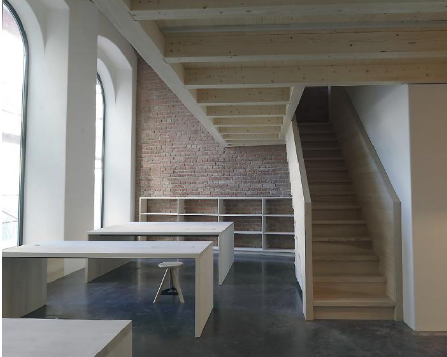
WB_10 ANTHRAZIT, ARCH. ZWETZBACHER BEREUTER, WIEN