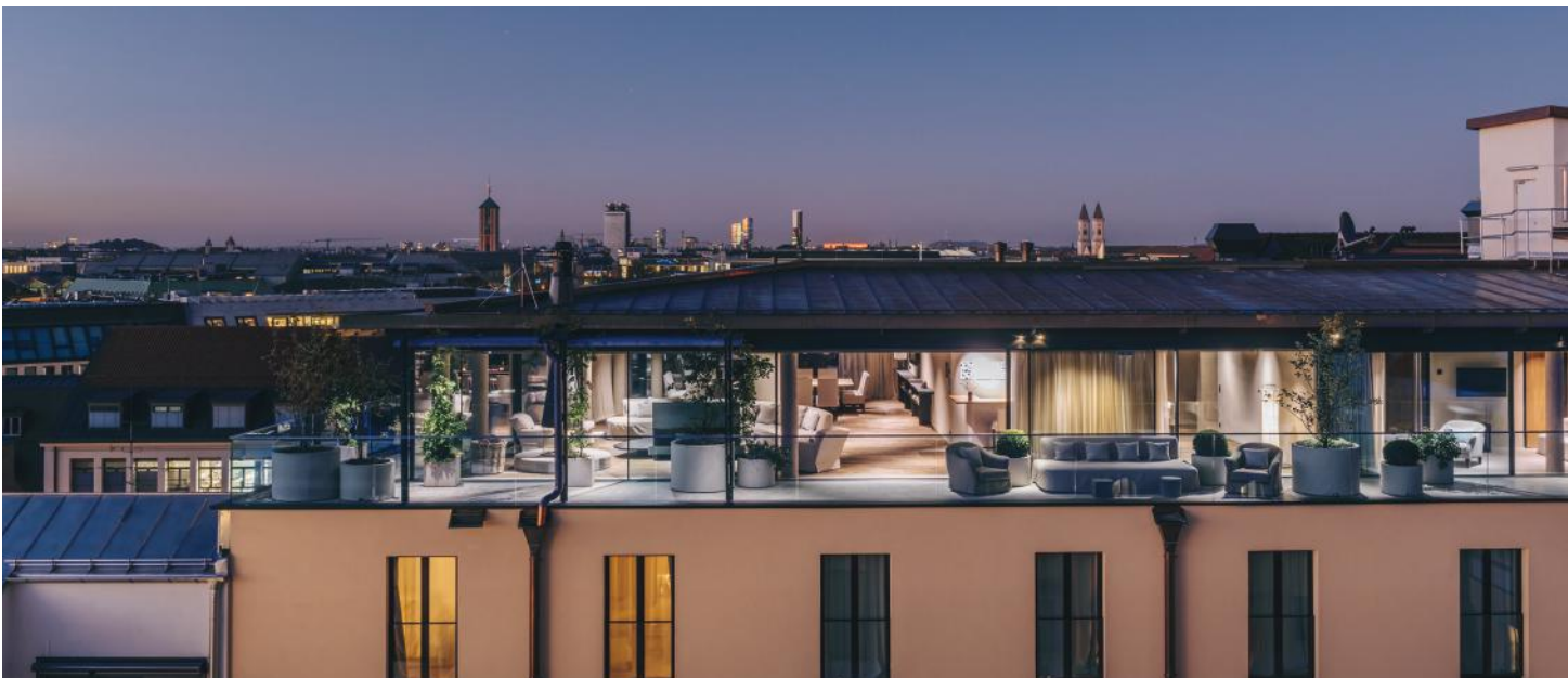
PENTHOUSE SUITE, GESTALTUNG AXEL VERVOORDT, HOTEL BAYERISCHER HOF MÜNCHEN