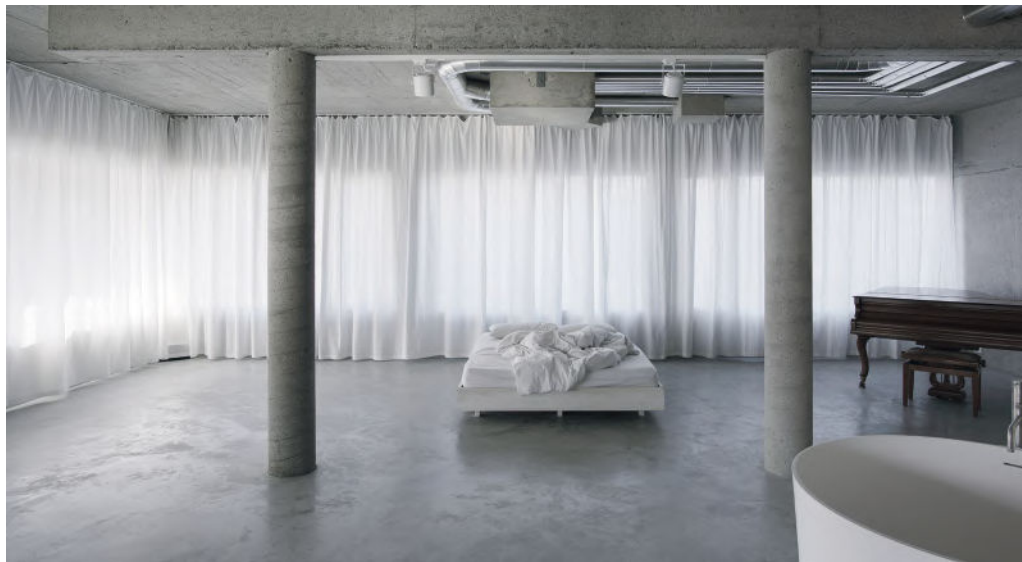
WB_10, UMBAU LOFT PRIVAT