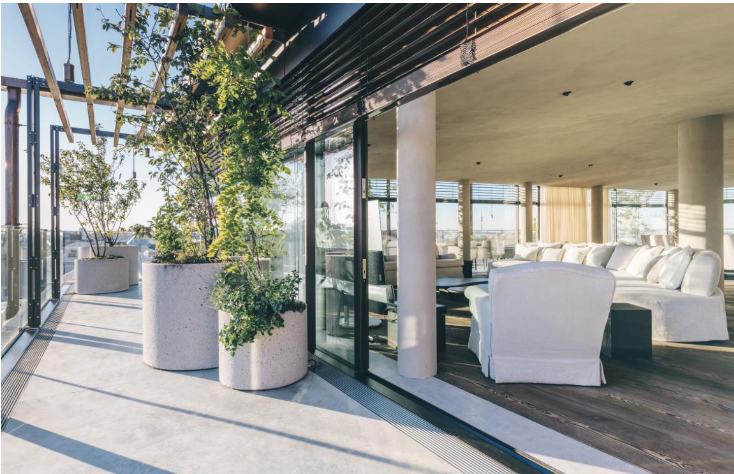
TERRASSE UND BETONFRIES, HOTEL BAYERISCHER HOF MÜNCHEN

...Sie sich für Wohnbeton interessieren! Auf den folgenden Seiten geben wir einen Einblick in unsere Firmenphilosophie und nehmen Sie mit auf eine Reise durch unser Leistungsangebot und unsere Referenzprojekte. Erfahrung macht unser Handwerk aus. Sichtbetonböden, Möbel und Paneele gehören zu unserer Kompetenz. Wir wünschen Ihnen viel Freude und Inspiration beim Lesen und freuen uns sehr über den Kontakt mit interessierten KundInnen und kreativen Menschen!