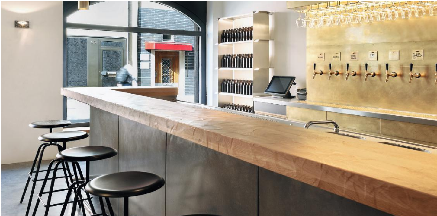
WB_1, BODEN UND PANEEL FÜR BAR, NÜRNBERG

Lösungen für die Vertikale entstanden aufgrund der großen Nachfrage unserer Kundinnen und Kunden. Paneele aus Beton mit nur zwei Zentimetern Stärke bieten Gestaltungsfreiraum für Wände und senkrechte Flächen.