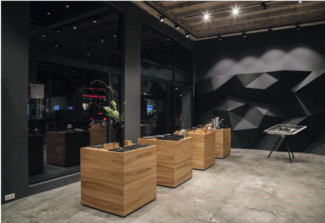
WB_1, SHOP STRICTLY HERRMANN, WIEN

WB_1 gibt es auch abgefärbt in Anthrazit, er eignet sich für Umbauten und in Shops, Lokalen oder wenn es besonders schnell gehen muss.