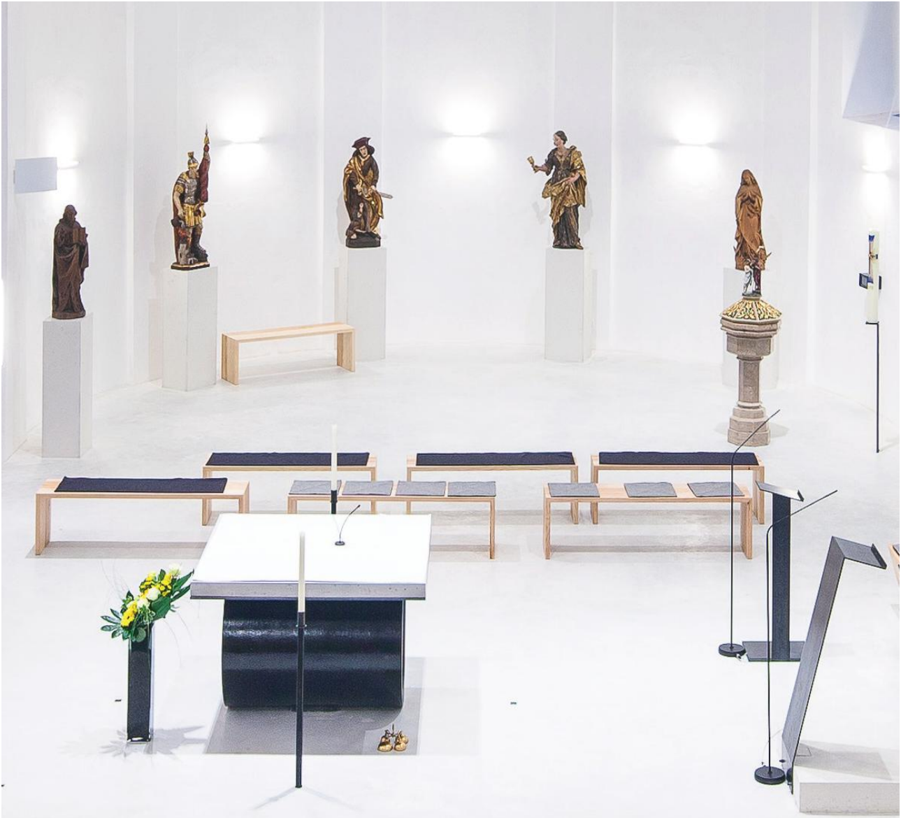
BETONBODEN WB_10, ALTAR UND SOCKEL AUS WEISSBETON, PFARRKIRCHE AMPFLWANG