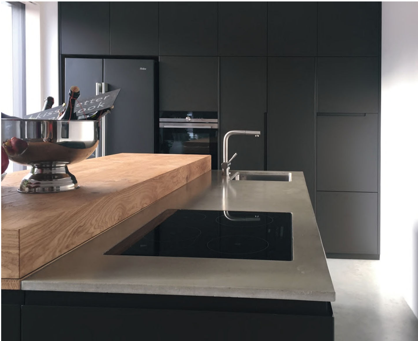
WB_10, BODEN UND ARBEITSPLATTE, PRIVATHAUS

Platten in verschiedenen Stärken und mit individuellen Details ergänzen unser Angebot. Nach Maß fertigen wir auch Theken, Regalelemente und individuelle Entwürfe. Auch in Bädern, als Fensterbank oder für den Kamin zeichnen sich die Werkstücke durch ihre Robustheit und Einzigartigkeit aus. Mit der Zeit entwickelt sich eine schöne Patina. Säure mag der Beton allerdings nicht, daher empfehlen wir möglichst schonende Reinigungsmittel, dem Beton und der Umwelt zuliebe!