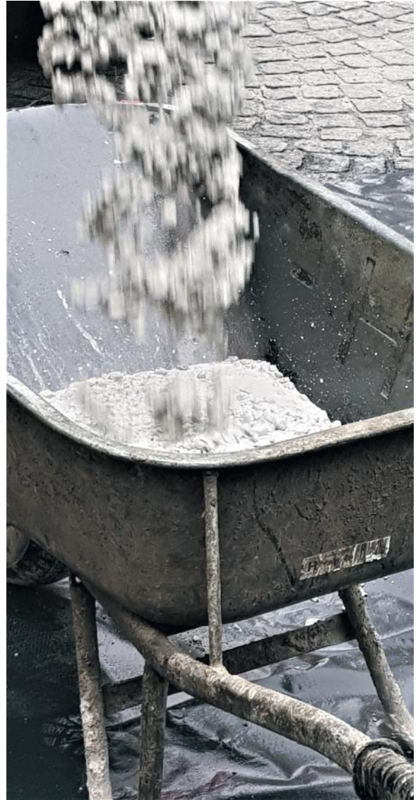
DIE SPEZIELLE ZUSAMMENSETZUNG MACHT UNSERE BÖDEN EINZIGARTIG

... zeigt sich der Boden erst nach einigen Arbeitsschritten. Die Möglichkeiten zur Gestaltung sind vielfältig. Um Details genau planen und umsetzen zu können, kommen wir bereits einige Zeit im Vorfeld zur Besprechung auf die Baustelle oder zur Projektbesprechung. Wir sind in der Ausführung meist eines der letzten Gewerke vor der Möblierung. In der Planung aber oft eines der ersten vor Ort, da sich durch zeitgerechte Detailplanung auch Kosten sparen lassen.