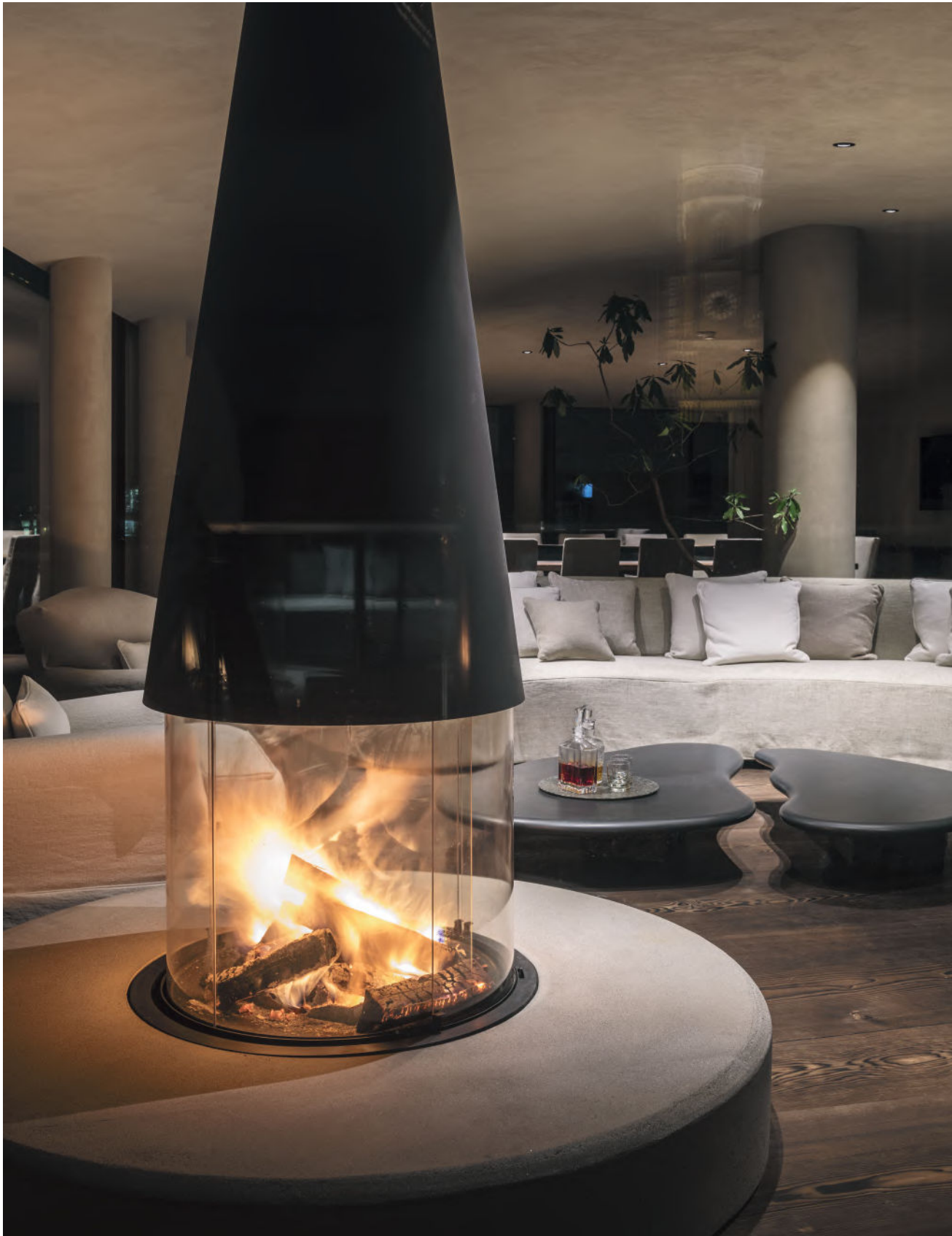
KAMINSTEIN AUS BETON, BAYERISCHER HOF MÜNCHEN