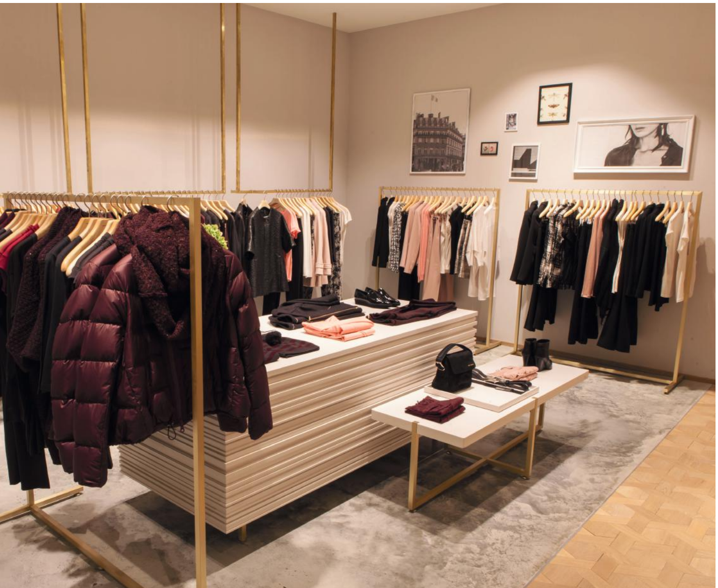
WB_1, RENÉ LEZARD SHOP, MÜNCHEN

Wohnbeton WB_1 ist die dünne Variante des Betonbodens. Ist der Estrich bereits hergestellt, können wir eine Schicht aufbringen, die ebenfalls „richtiger“, „echter“ Beton ist. Im Ergebnis ist WB_1 aufgrund der Betonzusammensetzung ein wenig dunkler und marmorierter als WB_10.