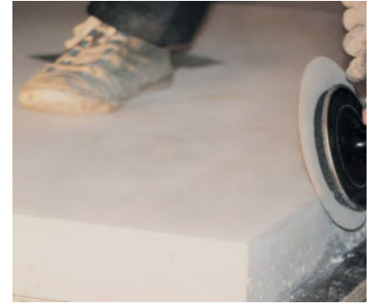
EINBRINGEN, GLÄTTEN, SCHLEIFEN, VERSIEGELN: DIE VERSIEGELUNG MIT WACHS IST DIE NATÜRLICHSTE OBERFLÄCHENGESTALTUNG, AUCH ACRYL IST MÖGLICH