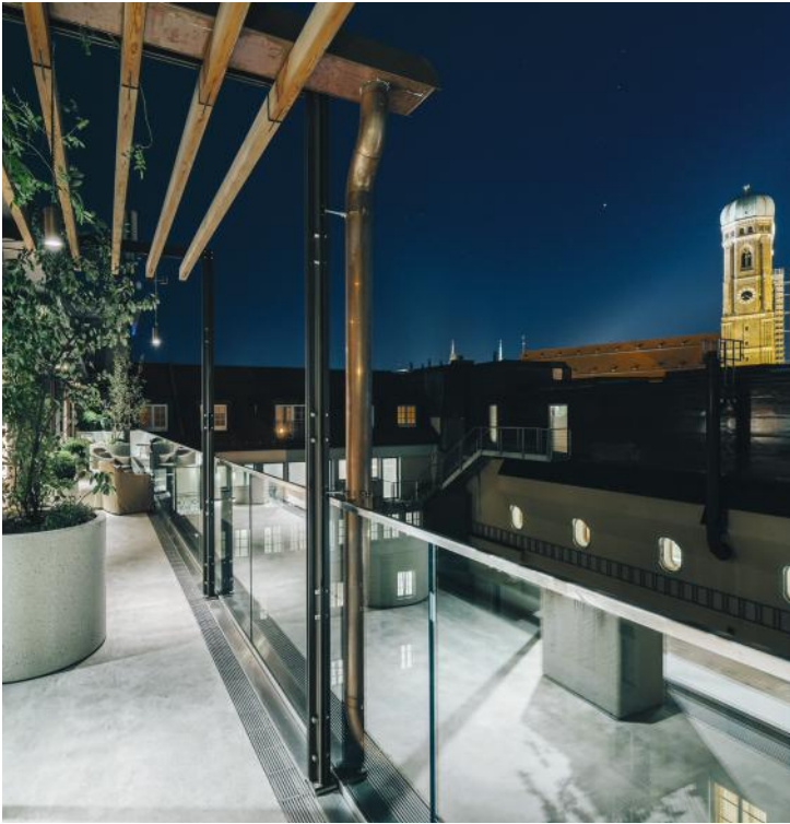
TERRASSE, HOTEL BAYERISCHER HOF MÜNCHEN

Planung, Fertigung und Abnahme geben wir nicht aus der Hand, dadurch können wir hohe Qualität garantieren.