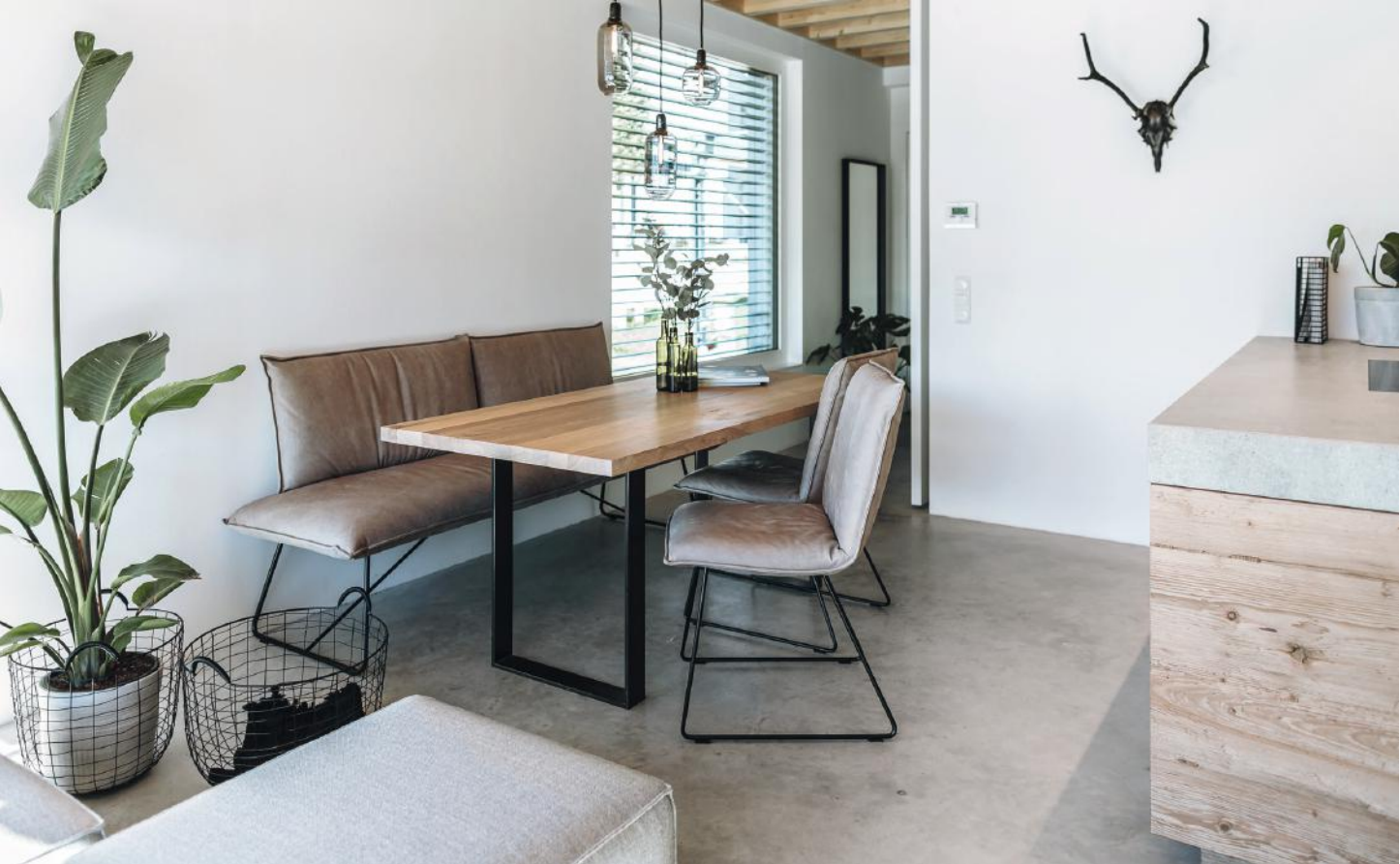
WB_10, PRIVATHAUS, RAUMKONZEPT KRUMHUBERDESIGN