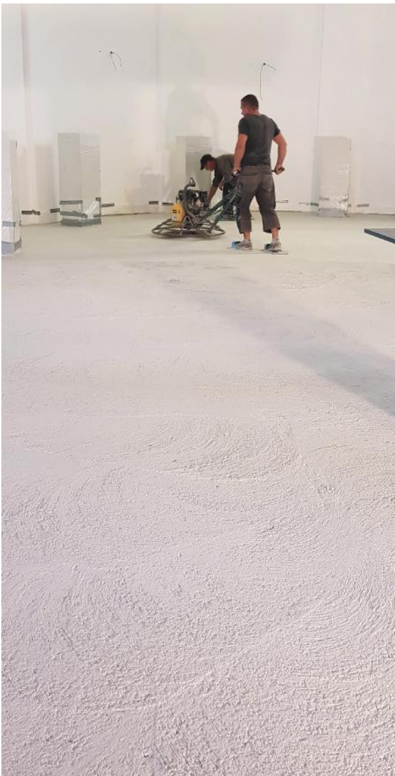
ILLI HAT JAHRELANGE ERFAHRUNG UND EIN GEFÜHL DAFÜR, WANN DER BETON ZU BEARBEITEN IST

Bis zum fertigen Boden bedarf es viel Erfahrung und Gefühl. Der Zeitpunkt, wann die Flügel der Glättmaschinen starten und wie lange geschliffen wird, ist entscheidend. Während des Glättprozesses kommt es durch Reibung und Temperatur zu verschiedenen Farbnuancen in der Betonschicht, die eine marmorierte Optik bewirken. Die Umgebung beeinflusst unser Handwerk - Temperatur, Wasser, Steine, die im Beton enthalten sind.