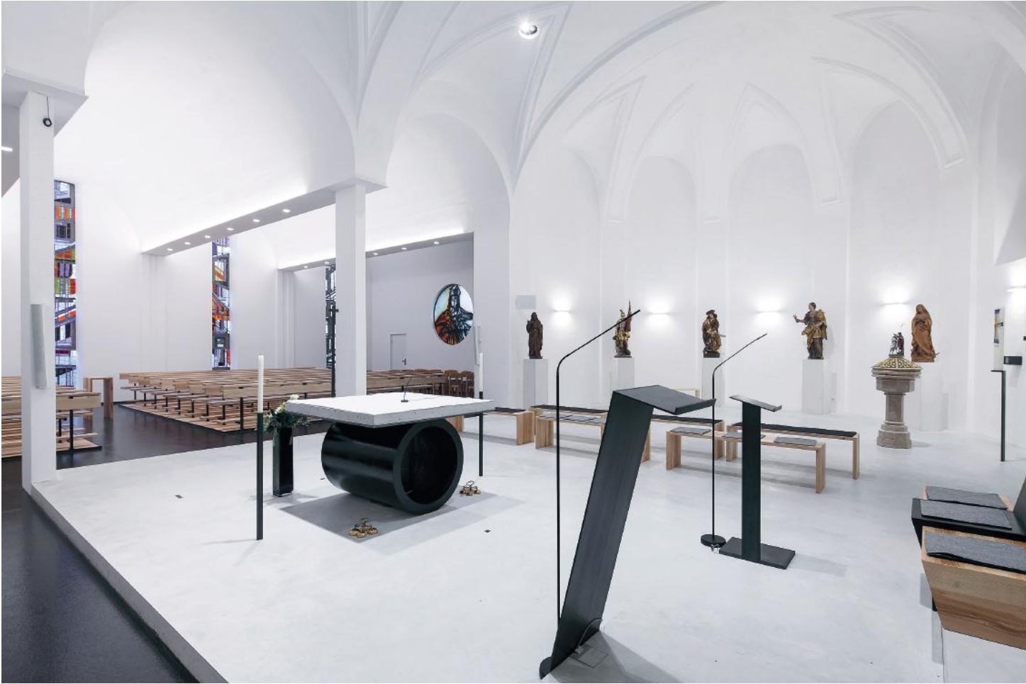
WEISSBETON ALTARRAUM, GESTALTUNG LENA GÖBEL, PFARRKIRCHE AMPFLWANG