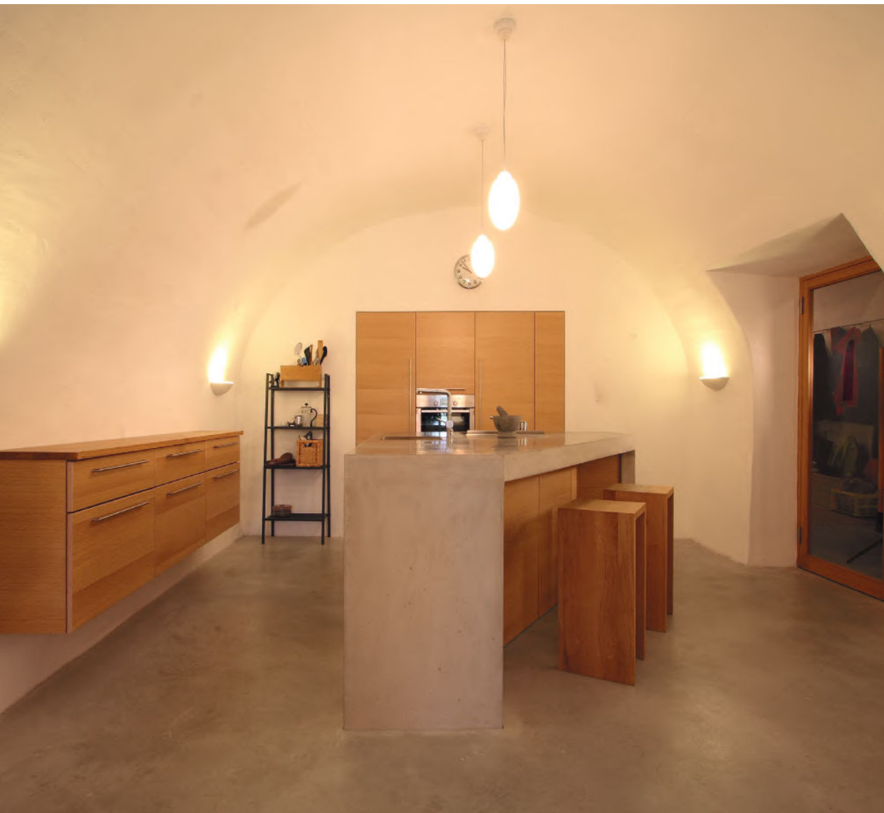
WOHNBETONBODEN DER ERSTEN STUNDE, PRIVATHAUS, OBERÖSTERREICH 2006