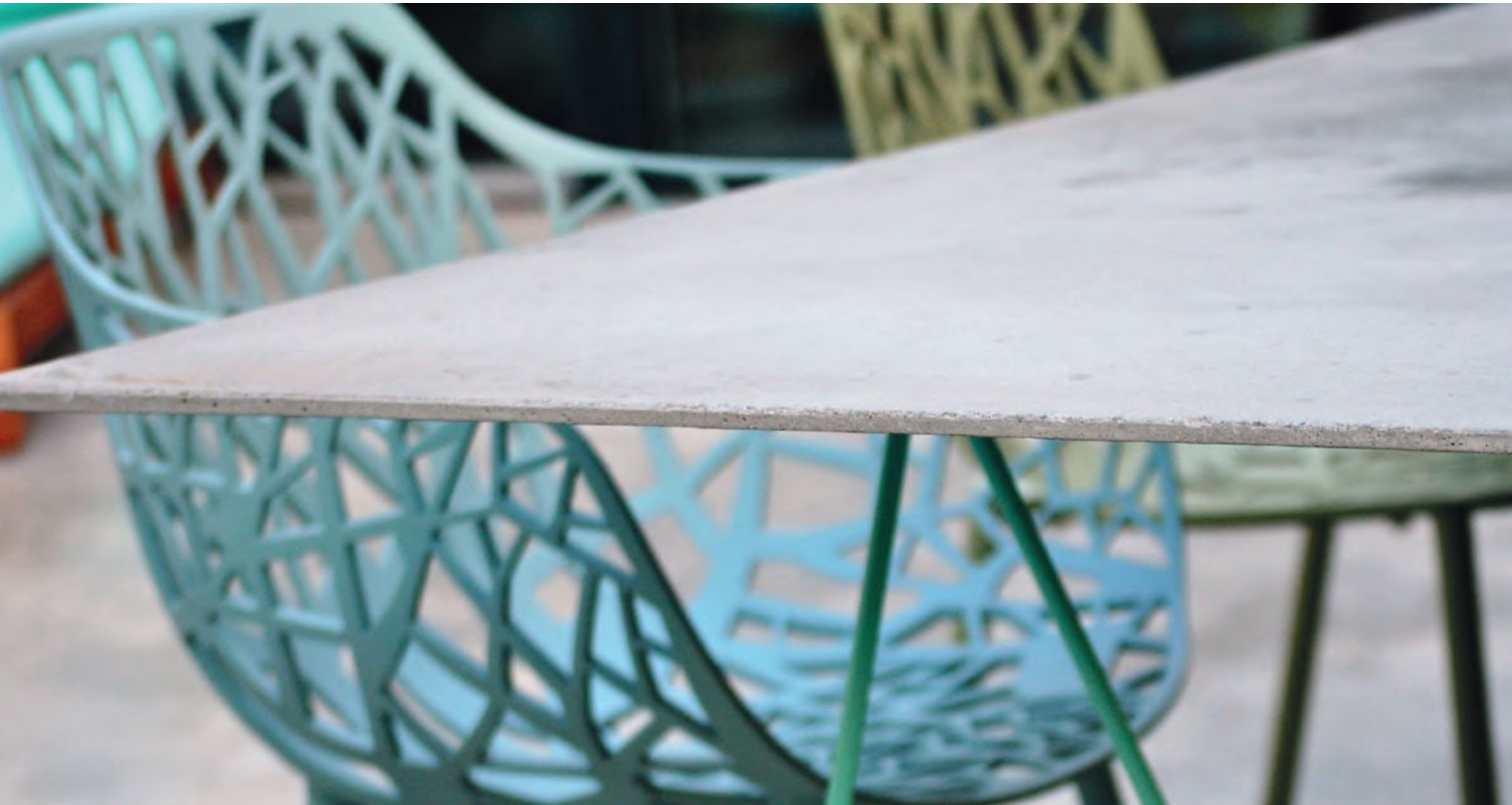
BETON TISCHPLATTE, ZWEI ZENTIMETER STÄRKE